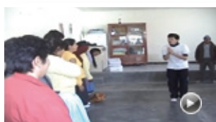
VIDEO TEATRO EN CHURCAMPÁ PARA SENSIBILIZAR A LA POBLACIÓN