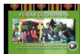
VIDEO PLAN REGIONAL DE IGUALDAD DE GÉNERO HUANCVELICA 2012 - 2017