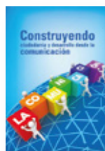
CONSTRUYENDO CIUDADANÍA Y DESARROLLO DESDE LA COMUNICACIÓN