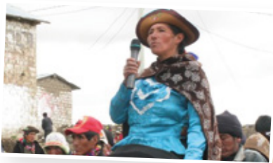
Grupo focal de mujeres de organizaciones, Huancavelica

“Hemos aprendido a presentar nuestro proyecto en el presupuesto participativo y hemos ganado. Hemos trabajado con 22 comunidades, yo soy la presidenta de club de madres y todas las presidentas informan a las mujeres para que conozcan las propuestas... yo soy campesina pero puedo ser mucho mejor que los profesionales para hacer los planes... me gustó mucho la incidencia, decir todo de los problemas de las mujeres”