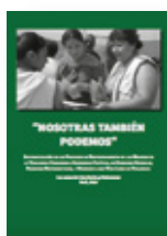
SISTEMATIZACIÓN "NOSOTRAS TAMBIÉN PODEMOS"