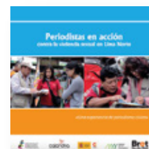
PERIODISMO EN ACCIÓN CONTRA LA VIOLENCIA SEXUAL EN LIMA NORTE