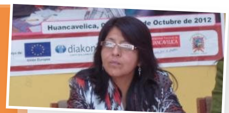
Entrevista a regidora de Surquillo, Lima. Directiva de RENAMA

“Me dio muchas oportunidades, capacitarme, conocer compañeras y sus experiencias y llevar las buenas experiencias (en gestión) a mi comunidad. Tener la posibilidad de participar en la escuela de participación política y eso me ayudó a ejercer una mejor función de fiscalización en mi distrito.”