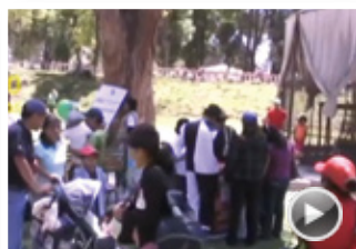
VIDEO RESUMEN DE LA EXPERIENCIA “TODOS HACEMOS POLÍTICA”