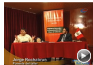
VIDEO DE TALLER ELECTORAL PARA PERIODISTAS