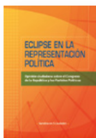
ECLIPSE EN LA REPRESENTACIÓN POLÍTICA, SONDEO DE OPIÓN SOBRE EL CONGRESO Y LOS PARTIDOS POLÍTICOS