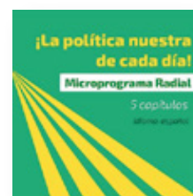
MICRO-PROGRAMA RADIAL “LA POLÍTICA NUESTRA DE CADA DÍA”