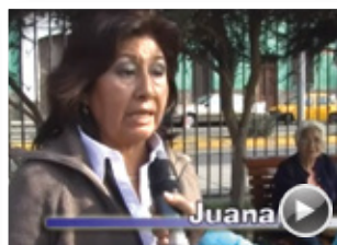
“VOCES CIUDADANAS ¿QUÉ PASA CON LOS PARTIDOS POLÍTICOS?”