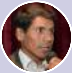
Ramiro Licona Alcalde de San Salvador

“Poco a poco nosotros estamos mejorando nuestros ingresos con la producción de kiwicha orgánica, necesitamos más apoyo y estamos seguros que lo tendremos” .