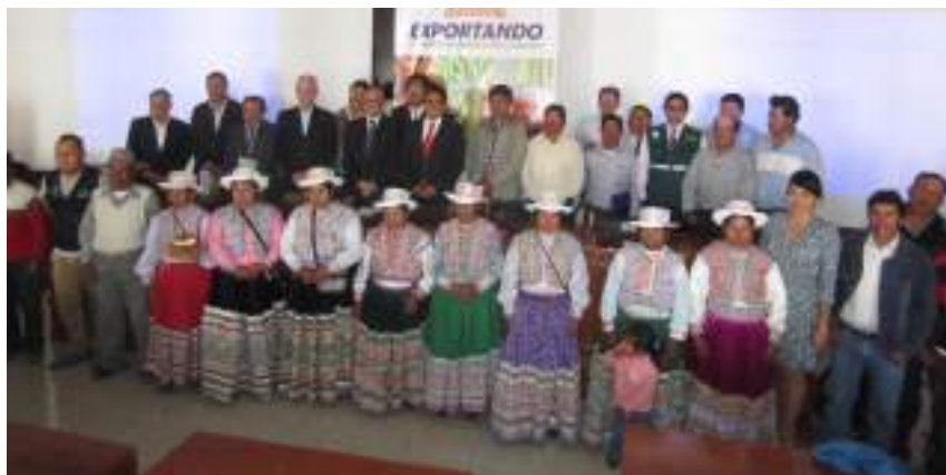
Representantes de gobierno nacional, gobierno regional y gobiernos locales, así como productores de quinua y kiwicha y Sociedad Civil tras culminar el foro.

La actividad pública visibilizó los hitos, aportes recientes y retos pendientes para el Gobierno Regional de Arequipa respecto a la implementación de la Política de Promoción de Exportación de Productos Ecológicos, así como generó compromiso público de los distintos actores de las cadenas de quinua y kiwicha orgánicas en la construcción de la agenda regional para impulsar ambas cadenas agroexportadoras.