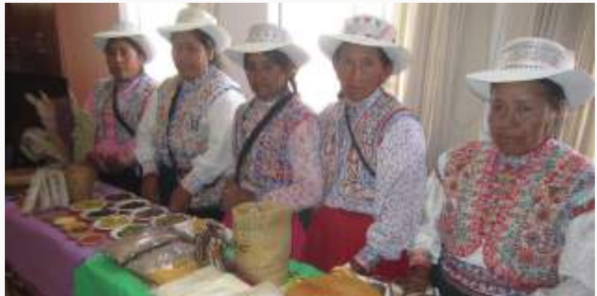
Productoras de quinua de Caylloma exhiben sus productos en foro regional Arequipa para el mundo.

La pequeña agricultura ha encontrado en los productos ecológicos una oportunidad para mejorar sus ingresos económicos, mediante el uso sostenible de la biodiversidad. Hoy por hoy, se promueven productos que brindan seguridad al consumidor, desarrollando buenas prácticas ambientales.